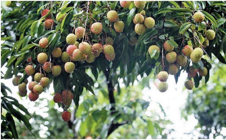
有些早果已经上市

羊城晚报讯 记者谢颖、通讯员蒋鑫、邹晓威摄影报道:距离“观音绿”上市还有不到半个月时间,却遇上连续多日暴雨,正处于生长关键期的果实由于吸收了过量的水分,出现严重的裂果现象。6月9日,记者从“观音绿”原产地东莞市樟木头镇金河社区了解到,如果暴雨天气持续下去,“观音绿”的产量可能会比预期减少5成。