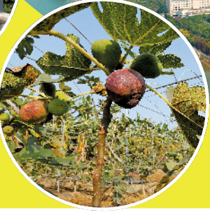
→洪梅乌沙围农业园