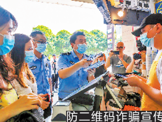
防二维码诈骗宣传

反诈民警介绍,嫌疑人利用“充值返利”方式骗取资金后,便立即交给“洗钱”环节的同伙变