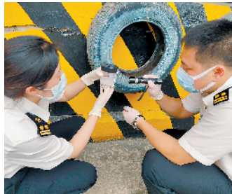
佛山海关驻禅城办事处工作人员正在对辖下口岸蚊媒密度进行监测

地回国,出现发热、肌肉酸痛、关节痛、头痛或皮疹症状的旅客,请主动向海关申报,配合做好流行病学调查和医学排查工作。