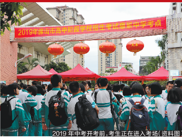
2019年中考开考前,考生正在进入考场(资料图)

6月10日,佛山市招生办公室公布了“关于做好佛山市2020年高中阶段学校招生志愿填报工作的通知”。按照通知,考生填报志愿时间为6月22日至28日。今年各类志愿共划分为7个批次,每批次内再划分若干个层次。