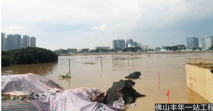
佛山丰年一站工程

方向以及广州、怀集、肇庆等方向。上述客运站的端午车票可通过“佛广集团”公众号选择对应的客运站提前购买。客运站场方面也提醒市民,为保障广大市民端午假期出行安全,客运站将严格落实上级部门防疫工作要求,做好乘客实名制及体温监测等工作,因此有计划出行的市民要佩戴好口罩、带身份证或户口本等有效证件进站乘车。