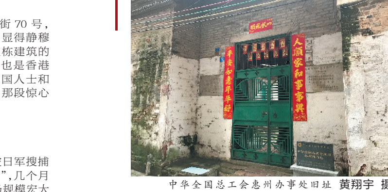
中华全国总工会惠州办事处旧址

“这里是私人住宅吗？”当记者看到大门两侧贴的红色对联时，不禁向附近的居民发出这样的疑问。居住在这条巷子的杨阿姨抬头看了一眼记者手指的那栋住宅，告诉记者，这里的确是私人住宅，但是主人并不在这里居住，也很少出现。当记者再问到，这里有没有政府接管时，杨阿姨摇头表示不清楚。 记者来到这栋住宅，位于惠城区桥西街道都市巷13号，这里曾是中华全国总工会惠州办事处旧址，同时也是广东省农民协会惠州办事处、中共惠州地方委员会、惠阳县农民协会旧址。 大门紧闭，且屋中无人，记者也看不到里面的情况。据资料显示，该建筑坐东向西，青砖瓦房，前后二进结构，中间有一个天井，共8房2厅，面积约300平方米。