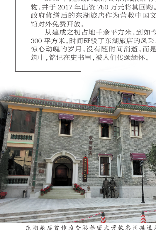
东湖旅店曾作为香港秘密大营救惠州接济站

1942年元旦，日军成立香港“军政府”，限令所有无工作、无住所的华人向日军报导师申办离港手续，并企图借机搜捕在港爱国民主人士和文化名人。然而这份命令恰好给了党组织实施大营救的机会。在香港党组织及进入港九地区的游击队员舍生忘死的掩护下，600多名爱国民主人士和文化界人士以“无工作、无住所人”身份，从九龙先后到达抗日游击队控制的宝安县白石石，然后再分批转移至惠州。 当时，中共惠州县委组织部长卢伟如扮成“香港昌业公司”经理，由香港来惠州做买卖，并以香港商人的身份包下东湖旅店二楼，作为秘密交通站。“卢经理”的朋友们纷纷住进东湖旅店，通过惠州中转，安全转移到内地。其中，茅盾、廖沫沙、胡绳、胡风、邹韬奋等人都曾先后住进东湖旅店。 这次秘密大营救，历时200多天，行程万里，遍及十余省市，共营救出抗日爱国民主人士、文化界人士及家属800多人。东湖旅店作为接待护送爱国民主人士和文化界爱国人士基地，历时半年之久。 2012年，惠城区政府公布东湖旅店为不可移动文物，并于2017年出资750万元将其回购。2018年，由政府修缮后的东湖旅店作为营救中国文化名人陈列馆对外免费开放。 从建成之初占地千余平方米，到如今只剩下不到300平方米，时间斑驳了东湖旅店的风采。然而，那段惊心动魄的岁月，没有随时间消逝，而是镌刻在了建筑中，铭记在史书里，被人们传颂缅怀。