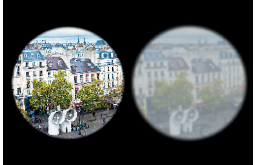
让更多人拥有清晰视野

有读者不明白：为什么有些人的白内障会引起青光眼，甚至有些人刚发现白内障就发生了青光眼呢？