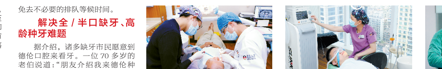
德伦口腔成为市民看牙首选

相信只有贴心的服务、先进科学的诊疗技术和人性化的诊疗模式，才能有效提高市民看牙满意度，令广大市民对德伦口腔更加信赖。