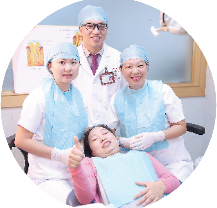
高品质医疗服务受到病人称赞

想患者所想,不断提升医疗技术和服务质量,提升患者就医体验,才能赢得百姓好口碑,实现医院长久性的跨越式发展,为建设品质东莞、健康东莞贡献力量。” 据悉,在2018年广东省二级公立医院绩效考核中,寮步医院成绩排名全省第四;并连续6年同时获得东莞市“医院综合管理工作优秀单位”及东莞市“妇幼卫生工作优秀单位”荣誉称号。在东莞市新一轮二甲医院复审中,该院也是东莞市第一家通过“二甲”医院复审的单位,而这些,也大大增强了寮步医院打造“东莞服务最好的医院”的信心。