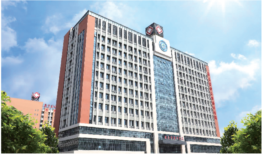
东莞市寮步医院综合门诊大楼

一家医院好不好,群众的就医体验和口碑就是最好的证明。今天,就让我们以第三方的视角,走进这家旨在“打造东莞服务最好的医院”——东莞市寮步医院,看看它是怎么样为群众提供高品质医疗服务的。