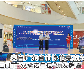
来自广东省消协的嘉宾为江门市“双承诺单位”颁发牌匾

江门市消委会介绍，自今年起，广东省消委会在全省消委会系统开展经营者“放心消费承诺”“线下无理由退货承诺”等放心消费创建承诺活动。“放心消费承诺”活动以“品质保证、诚信保证、维权保证”为基本内容，“线下无理由退货承诺”活动遵循“自愿承诺，自主实施，承诺即受约束”的原则。江门市首批“广东省放心消费承诺单位”共40家，“广东省线下无理由退货承诺店”共18家，涉及移动通信、汽车销售、零售商