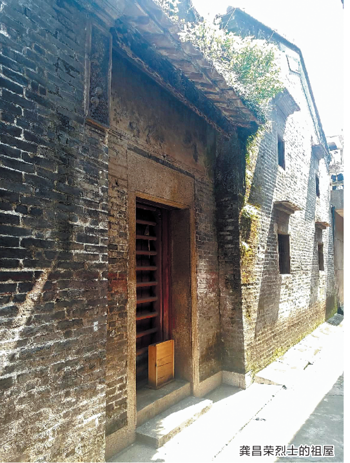
龚昌荣烈士的祖屋

记者23日从江门市委宣传部及江门市蓬江区政府方面获悉，在“七一”建党节来临之际，中共江门市党史研究室公布了祖籍江门的革命烈士龚昌荣事迹。据悉，龚昌荣在大革命时期和土地革命时期，于广州、海陆丰、香港、上海等多地隐秘保卫党中央，1935年在南京牺牲。其祖屋位于江门市蓬江区水南龙环里58号，今年5月被核定为蓬江区不可移动文物。未来，相关部门计划在原址上建设博物馆，向广大人民群众展示烈士英勇事迹，传承江门红色基因。