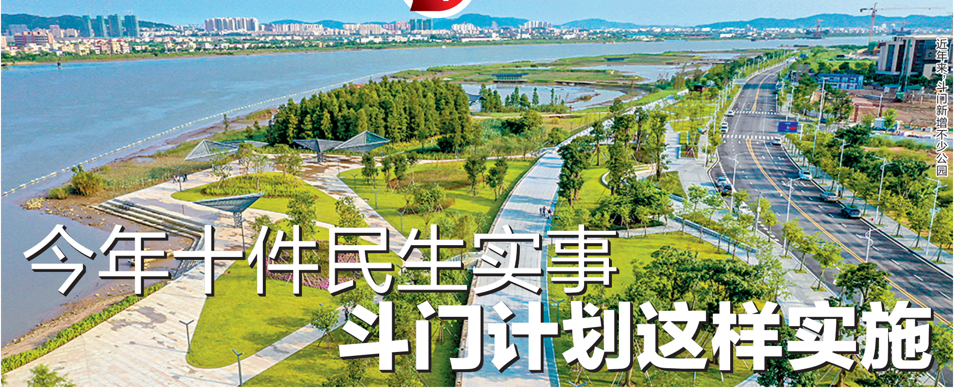
近年来，斗门新增不少公园

今年的政府工作报告提出，2020年，斗门区要继续办好系列民生实事，优先促发展稳就业保民生，坚决打赢三大攻坚战，高质量全面建成小康社会。这十件群众呼声最高的民生实事具体有什么计划安排呢？请随笔者一看。