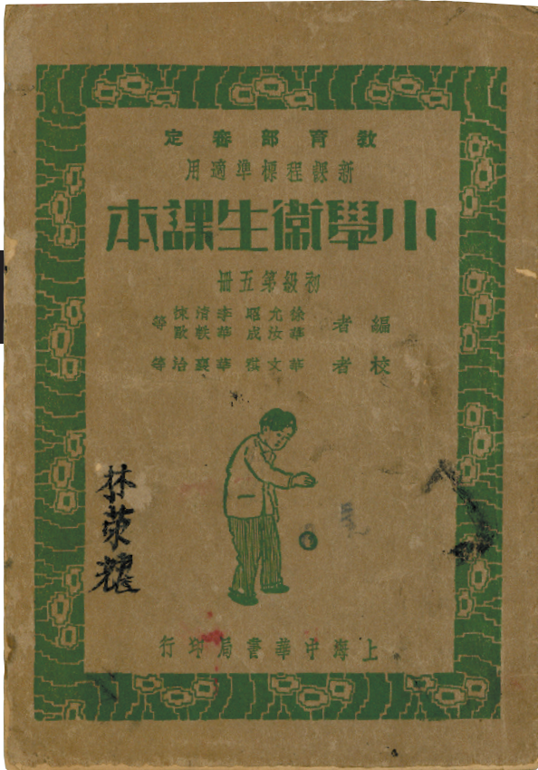
1935年中华书局印行的《小学卫生课本》封面（初小第五册）