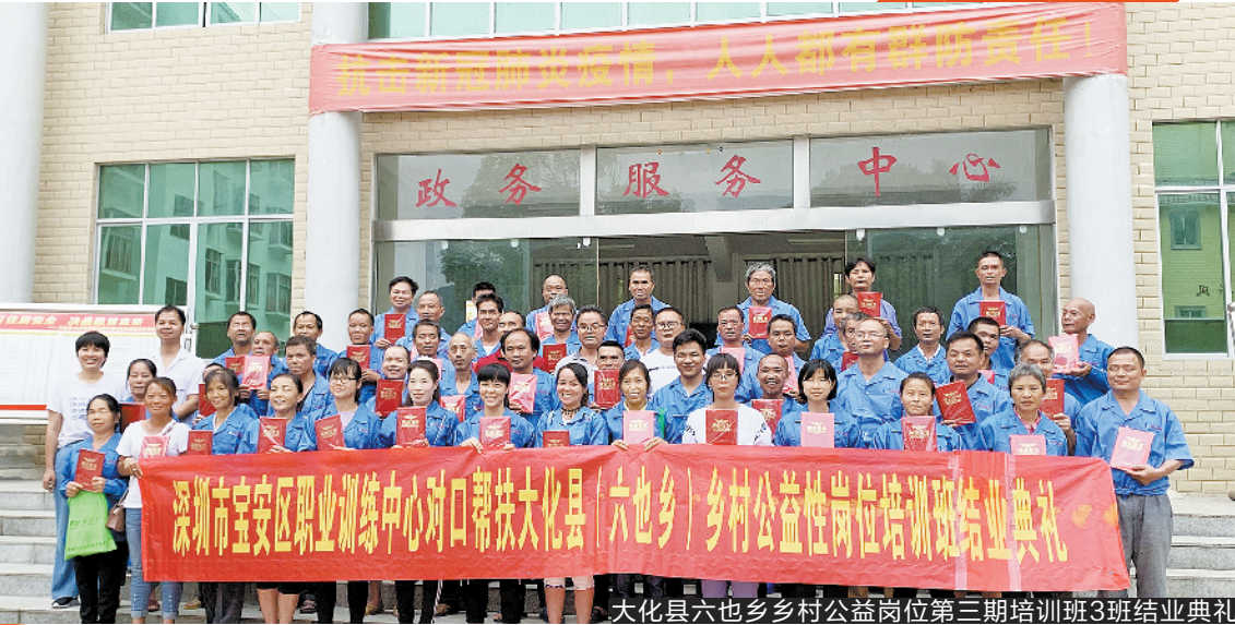
大化县六也乡乡村公益岗位第三期培训班3班结业典礼

据了解,培训完成后,两地人社局会组织参加此次乡村公益岗位培训的700名学员在乡村公益岗位上就业,每月工资1300元;另外,大化县人社局部门将集中推荐获证电工、电焊工学员赴省外、县外一些优质企业就业。