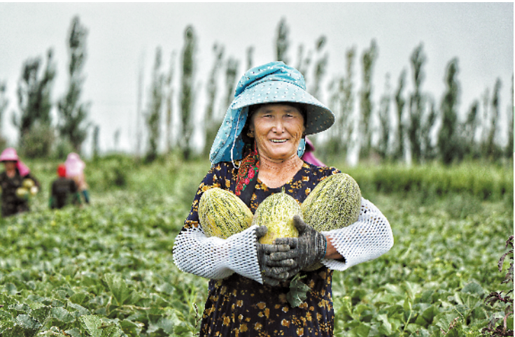
一位伽师农户拿着伽师瓜,这是她脱贫增收的希望

“今年结合吉利村、罗南村,辐射吉利村规划打造的汽车产业区、观光休闲体验区和罗南生态园,选取‘X515 小杏线—C226 海院线—Y983 南竹线—Y974 南隆线’,创建‘四好农村路’示范路,进一步提升路域环境,服务沿线村居第三产业发展及历史文化。”禅城区交通运输局相关负责人表示。