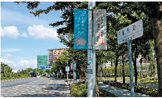
凤凰街道辖区主干道上灯杆旗显“文明元素”