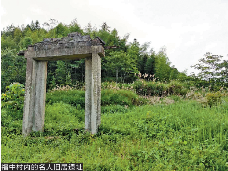
福中村内名人旧居遗址

赣南山区，风光旖旎，山道逶迤。乘车从江西寻乌县县城到福中村，大约需要两个小时。作为“罗福嶂会议”旧址所在地，福中村兼具红色资源和绿色生态环境，为帮助当地脱贫攻坚，从去年10月开始，龙岗布吉街道辖区企业深圳百合控股集团就来此深入调研，并决定捐资改造“罗福嶂会议”旧址，将其作为深圳龙岗对口江西寻乌的帮扶项目来打造。