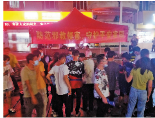
禁毒、防邪宣传走进富士康

相对于年轻人，年长一点的务工人员对毒品的防范意识会更强一些，因为他们不会好奇地去试探新的事物，但邪教组织却是他们防不胜防的