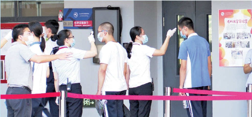
考生排队接受体温检测后步入考场。

7日8时30分，大鹏新区成立以来首批201名高考考生接受体温检测后分别步入考场。