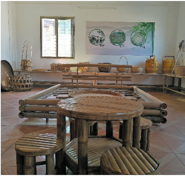
卢溪村竹制品厂，横庄村村景

同时，隆文镇还将党支部建立在企业，通过党建引领来增加农户的收入。广东省正佳农业发展有限公司是隆文镇一家生产有机米和烤烟的省级龙头企业。该公司成立党支部后，向农户集约了4000多亩的田地种植烤烟和水稻，同时聘用贫困户到公司打工，农户出租田地有租金，打工有工资，形成了良性的脱贫机制。