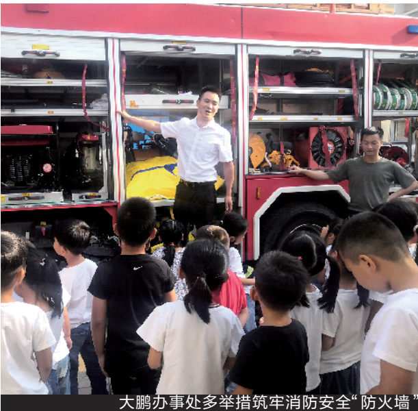
大鹏办事处多措并举筑牢消防安全“防火墙”

消防安全关系千家万户。大鹏新区大鹏办事处全面开展火灾高风险区域整治工作,一年来,累计排查火灾高风险区域的四类场所2834家(栋),整治隐患13458处。不懈努力,结得硕果。近日,大鹏办事处辖区的“三小”场所、出租屋、公共场所、工业建筑、市政消防栓等全面通过检查验收,大鹏办事处火灾高风险区域整治成绩达标,予以摘牌。