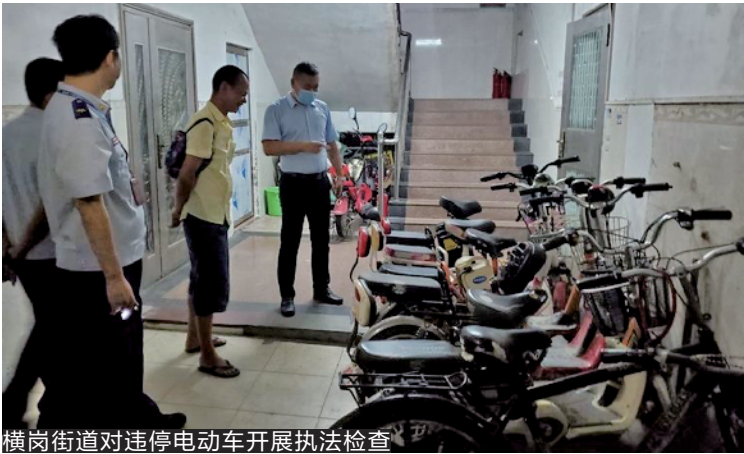
横岗街道对违停电动车开展执法检查

同时,大鹏办事处着力打造全面覆盖的消防力量体系,组建1支办事处专职消防队、4支企业消防队、7支社区微型消防队伍、6支志愿消防队体系,合力排查整治各类消防安全隐患。另外,大鹏办事处委托大鹏自来水公司对197个市政消防栓实行“一栓一档”管理,并先后开展消防专题“大培训”。(文/图 蒋佳元 江小妹 李若石)