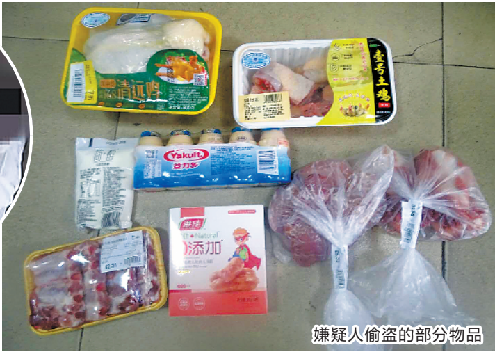
嫌疑人偷盗的部分物品

某生超市实行全自助购物结账,经常有人利用这一点在结账时逃单。7月3日,盒某某生超市员工核对商品数目时,发现异常,经过细致调查后,他们把目光放在了一对中年男女身上。7月7日,这对男女和往常一样走进超市购物,当他们挑选完满满一辆购物车商品,正要未结账商品打包好带出超市时,被附近的员工拦下。