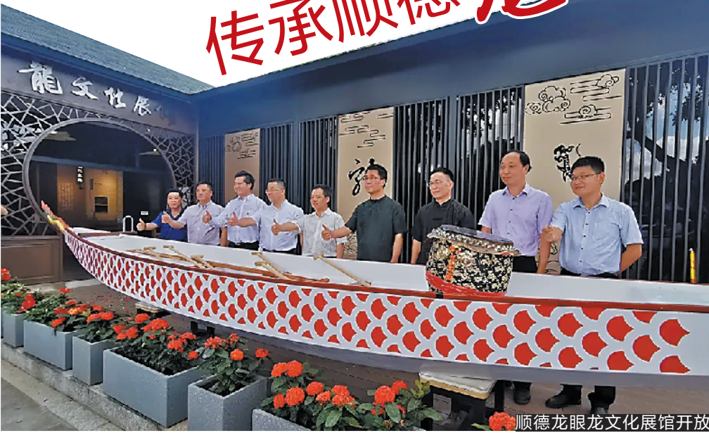
顺德龙眼龙文化展馆开放

顺德勒流的龙眼村是保留着“龙眼点睛”这一省级非遗民俗的千年古村落,也是顺德龙舟文化保存最好的地方之一。近日,位于勒流龙眼村的龙文化展馆正式揭幕,该馆整合了顺德近600年的龙舟文化,为广大市民游客提供了解认识龙文化的平台。