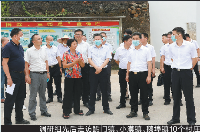
调研组先后走访鲘门镇、小漠镇、鹅埠镇10个村庄

作为深圳唯一拥有农村的区域,深圳市深汕特别合作区(以下简称“深汕合作区”)是深圳落实乡村振兴战略的主战场和打赢脱贫攻坚战的关键一环。7月20日,深汕合作区党工委書記产耀东率队调研鲘门、小漠、鹅埠三镇乡村振兴和脱贫攻坚工作推进情况,拧紧脱贫攻坚“动力阀”,点燃乡村振兴“助推器”,以决胜的姿态,奋力冲刺脱贫攻坚“最后一公里”,啃下乡村振兴的“硬骨头”,努力打造具有深圳标准、体现深汕特色的都市乡村。