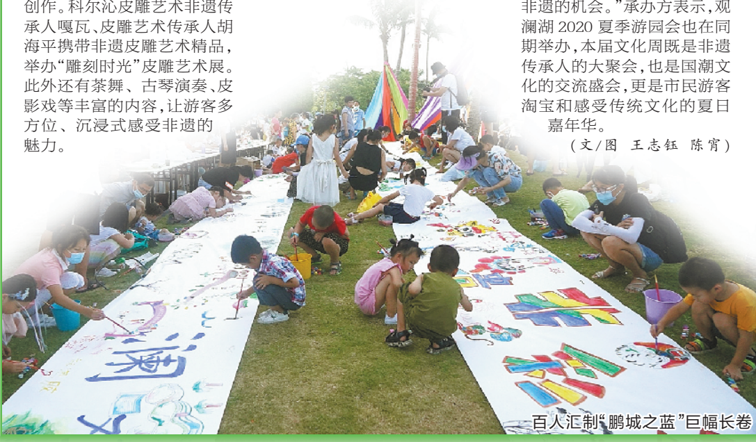
百人绘制“鹏城之蓝”巨幅长卷