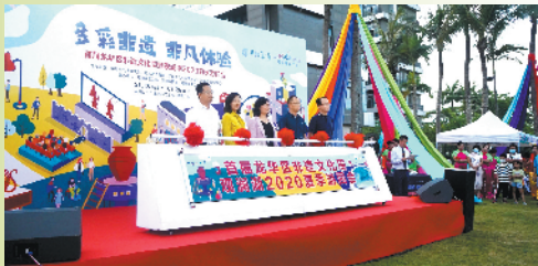
▲龙华区首届非遗文化周开幕