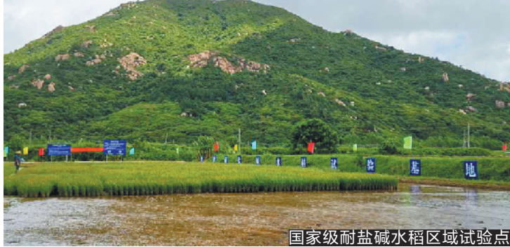
国家级耐盐碱水稻区域试验点