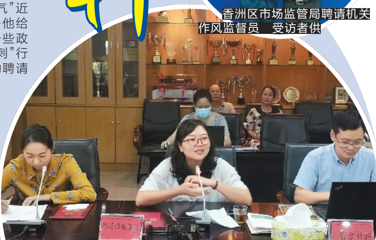
媒体监督员为珠海香洲教育建言献策

网友“爱如空气”告诉记者，珠海大多数政府部门是真抓实干，是真诚地与监督员们交朋友的。“如市卫生健康局、区市场监管局、区教育局、区城管局等，不仅组织监督员开座谈会，还给监督员们布置工作任务、传授监督方法、明确责任，同时认真倾听我们监督员的意见与建议，对我们反映的问题，都迅速反馈。” 但他指出，有些单位虽然聘请了监督员，却聘而不用，聘而不管，以致监督员成了摆设。比如，有的单位只是在年初开个会，大张旗鼓地给监督员发个聘书，而后就