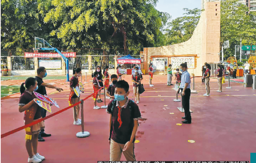
香洲招聘高素质教师，将进一步提升该区教育水平(资料图)

7月27日下午，金湾禁毒社工冒着酷暑在小林社区里走街串巷，向每一位商铺老板讲解禁毒知识，同时展示便携式仿真毒品，为商家送去一份“清凉消暑”的禁毒知识大餐。（金轩）