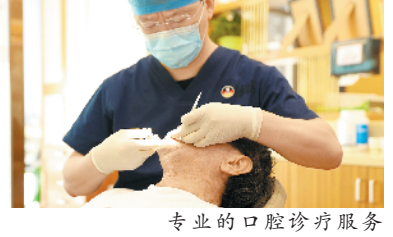
专业的口腔诊疗服务