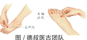
图 / 德叔医古团队