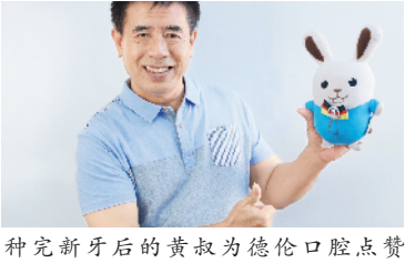
种完新牙后的黄叔为德伦口腔点赞

“广东省爱牙工程”派福利，即日起致电 020-8375 2288 申领 5000 元 / 颗种牙补贴，抢 0 元种植牙方案设计名额，享博硕学位种植名医亲诊，免挂号费、专家会诊费！