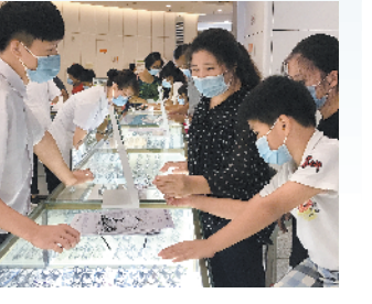
暑期配镜的主力军是学生

这里要提醒的是，好多家长都认为孩子处于换牙时期，就算有蛀牙，只要等烂牙脱落，换出新牙就没事了。其实不然，如果孩子有烂牙，比如说六龄齿是没换的，这个牙齿如果坏到不能保存就很可惜。