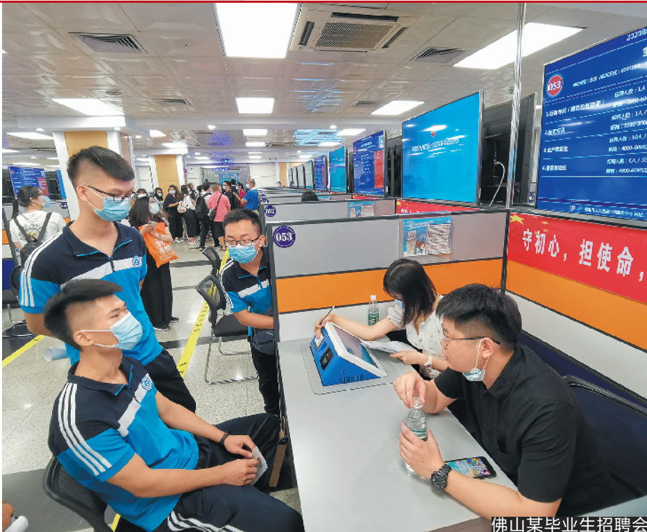
佛山某毕业生招聘会

于本地最低工资标准给予补贴,见习结束后留用的再给予见习留用补贴。同时,实施民营企业就业支持行动。深入开展“民营企业招聘月”活动,收集高校毕业生信息并进行精准推送,搭建民营企业 and 毕业生专属对接平台。充分发挥各级工商联、行业协会、协会及异地商会的组织优势,发动民营企业参加招聘系列活动,重点帮扶高校毕业生就业。