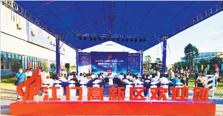
▲江海区二季度重点项目集中开工(投产)活动现场。上半年该区引入了多个高质量产业项目

作为江门唯一一个国家级高新区所在地，江门市江海区今年上半年克服了新冠肺炎疫情的影响，实现了逆势增长。记者11日从江海区政府获悉，今年上半年，江海区工业投资一直保持两位数正增长，其固定资产投资增速、工业投资增速均排名市区第一，展现了该区巨大的经济韧性和长期稳定发展的坚实基础。