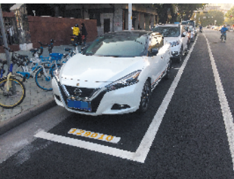
江门市蓬江区环市路的停车位，大部分车辆都保持顺向停放

羊城晚报讯 记者陈卓栋、通讯员谭耀广摄影报道：记者11日从江门市政府获悉，日前江门市印发《江门市开展机动车按标识方向规范停放专项行动工作方案》(以下简称《方案》)，从今年7月至12月，江门市区开展“机动车按停车位泊位标识方向规范停放”专项行动，力争在9月底前，江门市区首批八类重点场所基本实现机动车按标识方向同向停放、顺向停放。