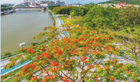
→江海区的城央绿廊