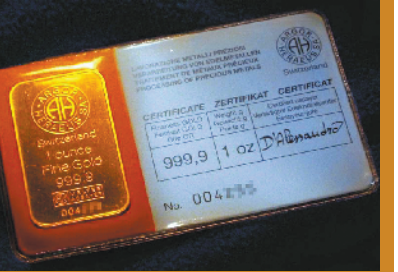
附带认证的1盎司金条