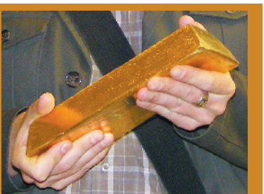
国际400盎司标准金条

2016年进入第7个牛市,开始是“慢牛”,但从2020年3月19日开始“疯牛”狂奔,2020年8月6日涨到每盎司2067美元。“疯牛”狂奔了一程精疲力竭,此后市场行情持续走低,到2020年8月12日12点32分(北京时间)跌至每盎司1864美元,短短6天跌了203美元,蒸发了9.8%。