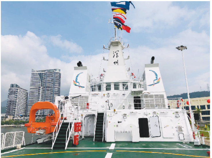
我国首艘油电混动海上执法船在深圳交接入列

据悉，深圳海上搜救中心是深圳市政府主管海上搜救救助、船舶防台和船舶污染事故应急工作的组织指挥和协调机构，总指挥由市政府分管领导担任，成员由海事、边防、渔政、消防等政府部门和企业组成，搜救中心办公室设在深圳海事局，负责应急值班和处理日常事务。“深海01”轮入列后，将承担水上安全监管、溢油监视、大气监测和事故应急等任务。