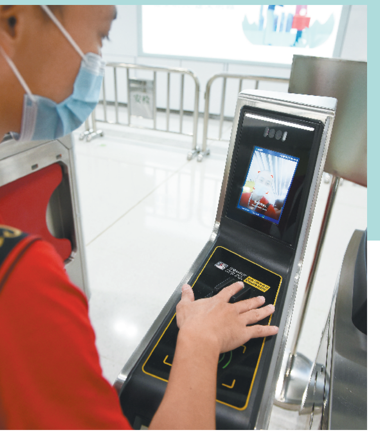
深圳地铁6号线开通

8月18日11时18分，深圳再次迎来两条地铁新线路的开通，地铁6、10号线共计78.7公里线路、沿线50个车站正式开门迎客。当天，深圳地铁四期调整工程首批4条线路也同步开工，再现“深圳速度”。