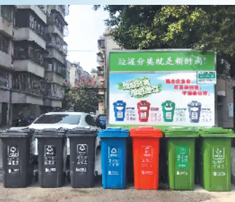
江门市已在市区小区内布置垃圾分类投放点

当前,江门市正加速推进垃圾分类工作。记者25日从江门市城管部门获悉,江门从建立全程分类体系、全民参与体系、长效管理体系等方面着手推进生活垃圾分类。根据《江门市城市生活垃圾分类工作实施方案(2020—2022年)》(下称“《方案》”),到2022年,江门要形成具有江门特色的城乡生活垃圾分类新格局。