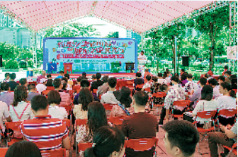
举办多场活动宣传垃圾分类

记者了解到,根据《方案》,2020年,江门集中力量开展全方位生活垃圾分类宣传发动;推进与生活垃圾分类相适应的垃圾处理设施建设;全市实现公共机构生活垃圾分类全覆盖;蓬江区、江海区基本建成生活垃圾分类示范片区,同步推进新会区会城街道、台山市台城街道、开平市长沙街道、鹤山市沙坪街道、恩平市恩城街道生活垃圾分类示范片区建设,完成江海区、新会区环卫一体化改革。