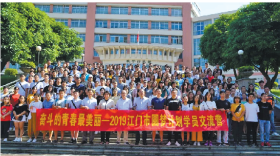
去年参加“圆梦计划”的产业工人合影

据悉,“圆梦计划”的学费标准为5000元/人,其中省财政补助2000元/人,市财政和社会募集资金(国资委下属企业)统筹解决2000元/人,被录取学员自缴1000元,也就是说在上学两年半时间里,平均每天只需1元钱。其中,来自广东省2277条省定贫困村学员或广东省建档立卡贫困家庭的学员,还可免除学员培养费用1000元,由省圆梦办一并补助。