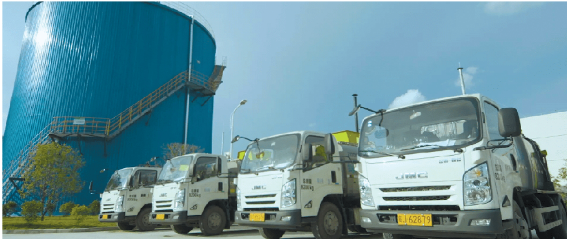
江门市的餐厨垃圾处理设施及垃圾转运车

门建成了市区餐厨垃圾处理厂,日处理能力目前为150吨,未来将达到300吨。从8月起,江门就实施了市区餐厨垃圾统一收运处置服务。