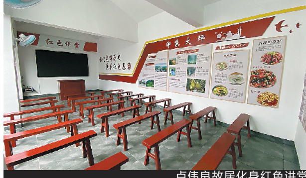
卢伟良故居化身红色讲堂

卢伟良在兴梅施政期间，面对百废待兴、百业待举的局面。他先后兼任兴梅地区调查统计委员会副主任、地方复员委员会主任、统战部部长、财政经济委员会副主任、人民法院兴梅分院院长等职。