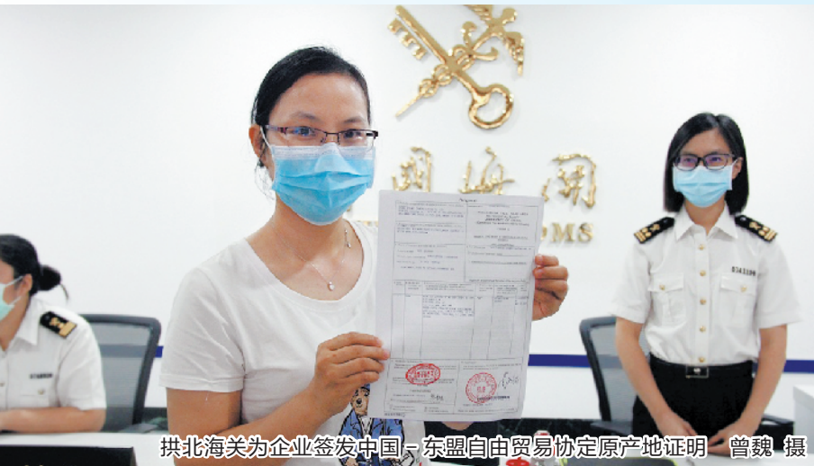
拱北海关为企业签发中国-东盟自由贸易协定原产地证明