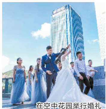
在空中花园举行婚礼

此外,屋顶通常还会引入承租能力弱,但具有特色的零售业态,如花店、书店等,既解决了商家的低租金支付问题,还为购物中心整体业态起到锦上添花的作用,增加丰富性。