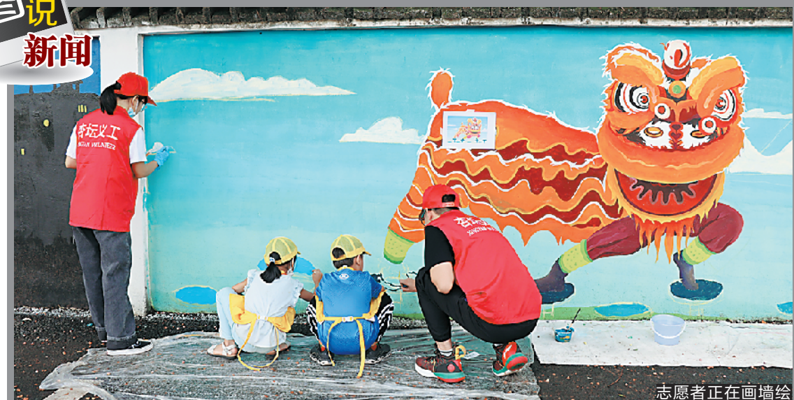
志愿者正在画墙绘