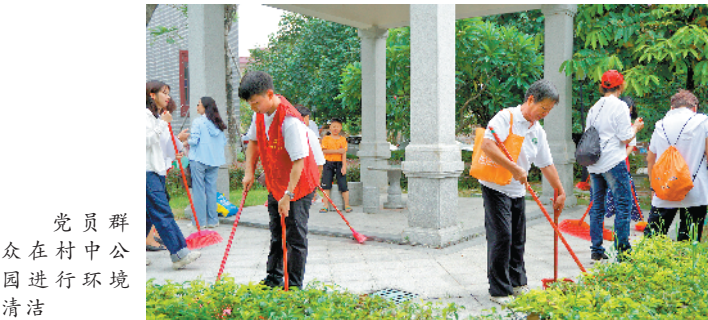
党员群众在村中公园进行环境清洁

“我们希望借此活动实现院内院外、房前屋后同步整治,引导大家共建美丽环境,一同参与到清洁乡村的行动中来。”顺德区农业农村局局长谭逢显说,通过活动发挥示范典型的带动作用,全面提升顺德区美丽乡村建设的整体水平。