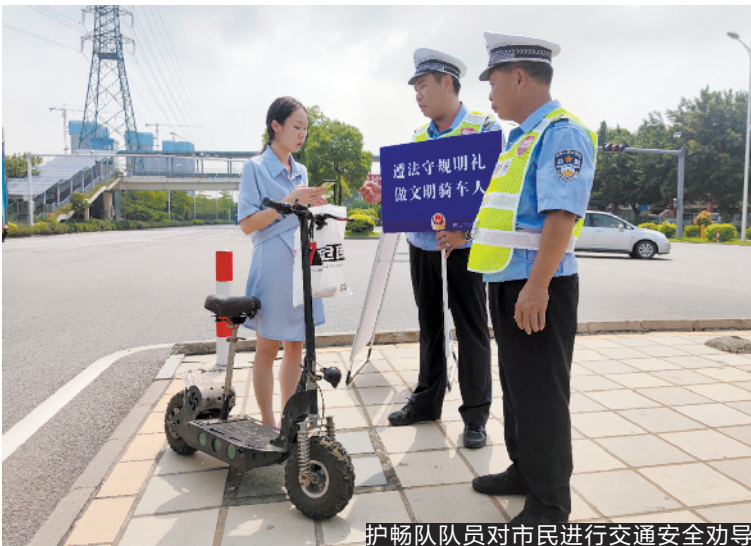
护畅队队员对市民进行交通安全劝导

运行1个月以来,“警村社”护畅队员在公安机关的指导下,协助交警对客车、校车、面包车超员,低速货车、拖拉机载人,电动车未按规定悬挂牌照、非法载客,摩托车未戴安全头盔、超员,以及机动车驾驶员涉酒驾驶等6类交通违法行为开展文明交通劝导,共出动1350余人次开展交通安