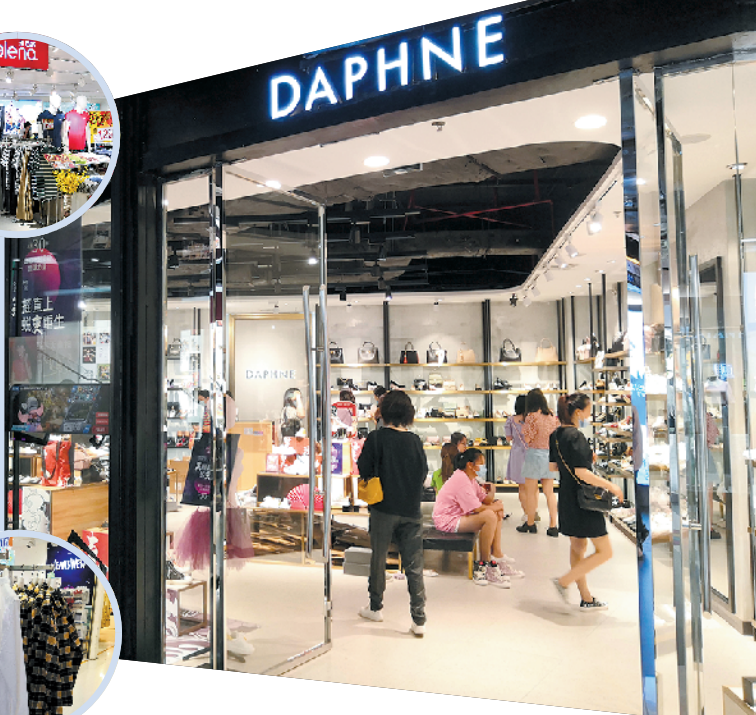
达芙妮广州时尚天河店