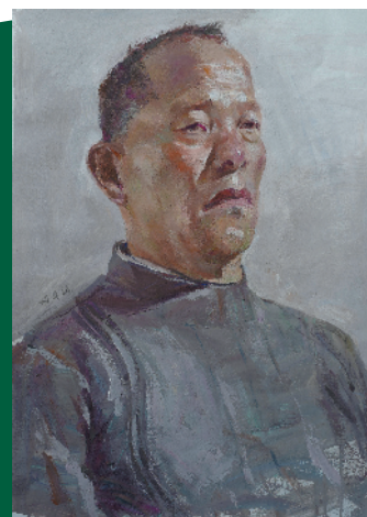
陈卓恒作品：《睿智的老先生》