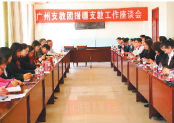
2019年4月12日,广州支教团召开援疆支教工作座谈会

增加编制之外,政府以购买服务等形式、通过严格考核临聘教师,基本做到同工同酬,且在人编考试时给予一定倾斜。