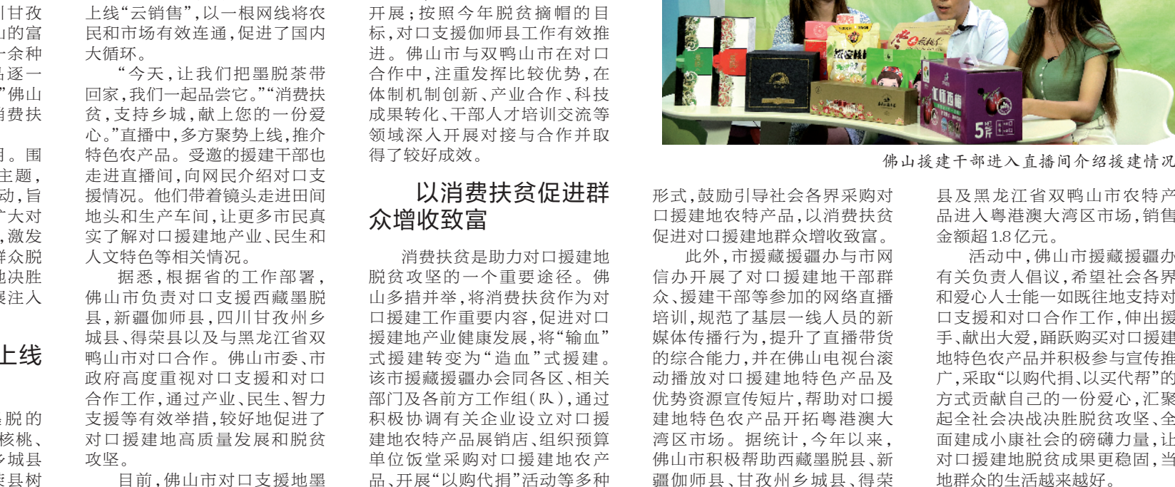
佛山援建地区农产品走进“直播间”

羊城晚报讯 记者张闻、通讯员冯翠萍摄影报道：西藏墨脱的茶、新疆伽师的新梅、四川甘孜的树洞蜂蜜、黑龙江双鸭山的富硒大米……9月11日晚，十余种美味又实惠的特色农产品逐一亮相“为爱拼单·扶贫有我”佛山市援建地区农产品走进“直播间”消费扶贫活动。