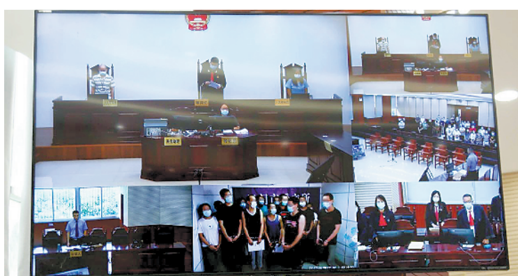
该案件采用远程视频方式审理

羊城晚报讯 记者陈卓栋、通讯员王双、罗君媛、谭耀广报道:记者16日从江门市蓬江区人民法院获悉,日前,江门市蓬江区人民法院通过远程视频开庭,公开集中宣判一批“套路贷”涉恶案件,涉案的15名被告人最高被判处四年有期徒刑,最低被判处二年六个月有期徒刑。 根据法院公告案情,2014年2月,魏某某、叶某某伙同吴某某、陈某某(四人均另案处理)等人先后注册成立深圳市盈聚投资管理有限公司等系列公司,在未取得存储、借贷资质的情况下,成立“立业贷”P2P平台吸收资金并进行车辆抵押借贷业务。随后该公司先后成立盈胜江门等多家分公司负责招揽业务,注册成立深圳人人有信管理服务服务有限公司,组织人员专门负责对逾期客户进行催收、拖车。 涉案的15名被告人入职后负责推销业务,吸引受害者上门贷款。签约时该公司业务人员刻意隐瞒部分合同内容,诱骗受害者签订借款额度虚高、含有违约陷阱的格式借款合同和空白车辆转让协议,以达到收取高额费用和利息的目的。在还款过程中,公司通过各种方式恶意垒高“债务”,一旦客户逾期,即实施“拖车”,并以变卖车辆相要挟,继续向借款人索要高额费用。 法院经审理认为,涉案的15名被告人无视国家法律,伙同他人实施“套路贷”犯罪而组成较为固定的犯罪组织,参与恶势力犯罪集团,采用欺骗手段,骗取他人财物。根据各被告人在共同犯罪中的作用,分别判处二年六个月至四年不等的刑期。 未取得中山市网约车平台经营许可 “花小猪打车”被叫停 羊城晚报讯 记者林翎报道:9月15日,中山市交通运输局在官网发布公告,“花小猪打车”网约车平台因未取得中山市网约车平台经营许可被叫停。 公告称,中山市交通运输局接到热心市民反映,近期不断收到网约车平台的短信,邀请车主注册“花小猪打车”网约车司机端,并承诺有高额奖励与补贴,吸引车主注册,但并未注明是否须要取得“网约车运输证和网约车驾驶员证”。 经中山市交通运输局核查,“花小猪打车”网约车平台在中山市未设立分支机构,未取得《中山