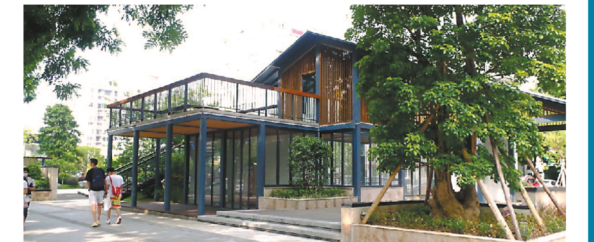
观摩团参观的育德社区,新建了口袋公园的设施

争取形成“江门经验” 据江门市住房和城乡建设局相关负责人介绍,2018年以来,江门市持续开展城市品质提升八大行动,并把老旧小区改造作为核心内容之一持续推进,以建设安全健康、设施完善、管理有序完整居住社区为目标,以完善居住社区配套设施为着力点,大力开展社区建设补短板工作,精细化推进老旧小区改造,建成了一批示范项目。老旧小区“旧貌”换“新颜”,人民群众的获得感、幸福感、安全感不断提升。 接下来,江门市将统筹好政策、机制、资源三大体系,协调好政府、社会、市民三大主体,实施好规划、建设、管理三大环节,全力推进老旧小区改造工作,在全局性、系统性、积极性等多个维度,争取再创新、再突破,加快形成可复制、可借鉴、可推广的城镇老旧小区改造“江门经验”。