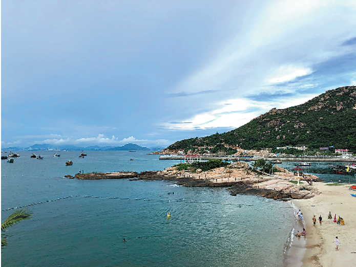
珠海万山群岛中的外伶仃岛一景

据万山区旅委办问卷调查结果显示，暑期海岛游客年龄层次集中在中青年，老年游客也多以中青年陪伴为主，无显著性别差异；出游陪伴人群主要以家人出游和朋友出游为主，其中家人出游中带孩子出游、年轻夫妇出游占比较大。海岛旅游消费情况差异明显，主要集中在过夜游客人均1500元以上水平和单日游客1000元以下水平。