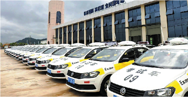
珠海高栏港小型汽车驾驶人全科目考场

考试实行全程监控，保证考试公平公正。值得注意的是，目前，全科目考场已经进入最后调试阶段，很快可以启用。