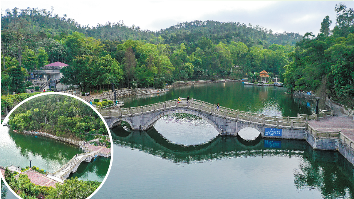
碧绿的湖水像一块璞玉

本次升级改造项目总投资约1000万元，面积72760平方米，按照“修旧如旧”的办法，保留公