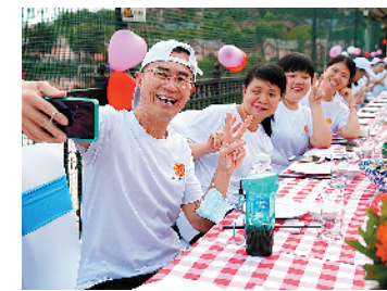
主办方将安排丰富多彩的活动

两级总工会共配备防控工作专项资金2550万元,专款用于疫情防控和服务工作。全面开展关爱慰问、医疗保障、生活保障、子女助学、志愿服务、线上咨询、疗休养和婚恋交友等8大项目。