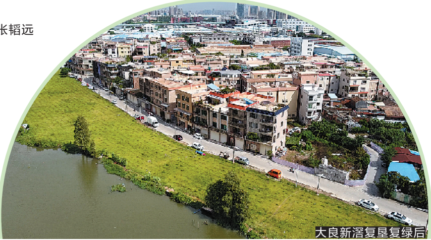
大良新溪复垦复绿后

近日,顺德区印发《地券管理操作指引》(以下简称《指引》),建立了全链条地券制度管理体系,标志着顺德区在构建复垦复绿新模式上开始了新的探索。《指引》实施后,将极大激活土地相关权益人拆旧复垦的积极性,促进顺德区村级工业园改造“生态复垦复绿模式”的进一步实施。