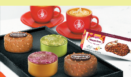
太平洋咖啡×哈根达斯联名月饼冰淇淋

近几年，国潮国风热度不减，广州各大商场在“十一”黄金周期间纷纷推出各种“中国风”的活动，供顾客领略传统文化魅力的同时尽情买买买。