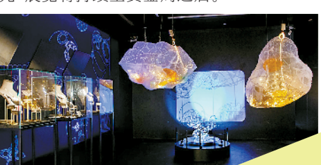
太古汇“浮游时光”艺术装置

据了解，艺术空间与装置共分为两个区域，其中腕表区以“浮游时光”为主题，位于公共区域，光线充足，便于品鉴精准时计。珠宝区位于特展区域，以“微观与漫游”为题，展示微观生物艺术装置、投影及荧光插画，萧邦、麒麟珠宝等品牌亦展出部分难得一见的高定珠宝藏品。同时，广州太古汇还邀请了IGI国际宝石学院权威解读珠宝的微观魅力和鉴赏要点。据悉，“浮游时光”展览将持续至黄金周之后。