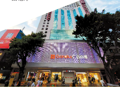
广百百货北京路店

假日期间，总少不了老友聚会，一场回忆青春之旅相信能够成为你的选择。广州凯德乐峰广场近日开启了“校服至上”主题校服展2.0，数十所广州中学的校服在广场内一一展示。羊城晚报记者近日走访注意到，凯德乐峰广场每一个楼层均已布置了不同的中学校服元素，在一处扶梯上下口处可以看到一面贴有各所中学动漫人物的“校服卡片墙”，实体的校服展示在楼层中央的护栏处随处可见，还有“校服至上”2.0的大型装置可供顾客拍照留念。