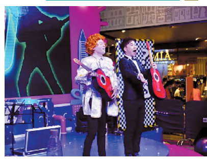
嘿皮匣子《疯狂音乐家》亲子音乐魔术互动剧

买足好物之余，不妨好好感受传统文化。9月25日至10月8日，广州正佳广场将举办锦鲤祠文化体验馆，据了解，本次体验馆依托锦鲤富豪的美好寓意，结合汉服潮流的复兴繁荣，打造创意国风美学艺术展，让游玩顾客亲身体验汉服传承。