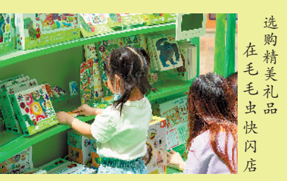
选购精美礼品 在毛毛虫快闪店

寓教于乐的礼物最适合孩子的成长。“十一”黄金周期间广州天汇广场igc的“毛毛虫大世界”主题展快闪店，涵盖帮助宝宝学习色彩的彩泥亲子游戏、启蒙益智的动物配对游戏、拓宽见识的精美图书、各种动物造型的木制玩具、小背包等，添加家长与孩子互动的欢声笑语。