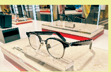
GENTLE MONSTER X 华为智能眼镜

朋友送礼，重在表达心意。近期，韩国眼镜品牌GENTLE MONSTER与华为在第一代智能眼镜产品的基础上将设计美学和进行全新技术进行全新升级，推出13款全新Eyewear II系列。Eyewear II系列可与手机配对，通过敲击镜腿来接听/挂断电话、播放/暂停音乐；滑动镜腿实现音量调节的功能和歌曲切换功能。个性化语音助手可随时确认天气或行程，朋友无需手机便可轻松获取并处理各类信息。