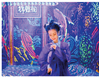
多个国风场景任你拍摄

9月30日至10月8日，广州天环广场将联合场内及独立设计师品牌，在天环南广场及喷泉广场打造一场“潮集”主题露天夜市，包括设计师的创意服饰、复古饰品、精致艺术及轻