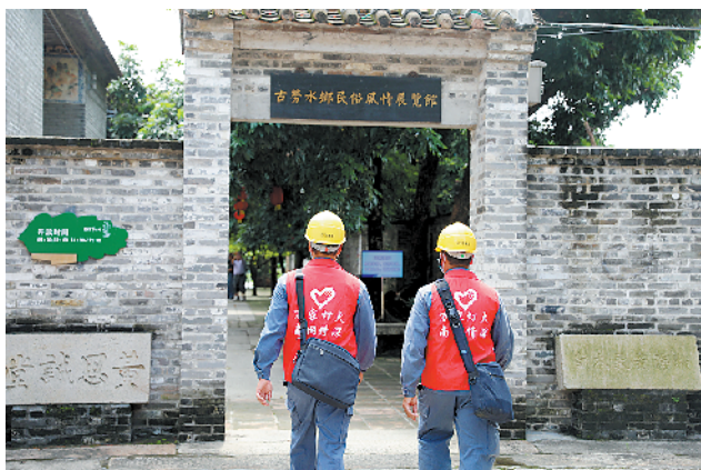
江门鹤山供电局党员义工服务队在古劳水乡景区开展安全用电宣传

中秋、国庆“双节”即将来临,为保障节日期间的用电安全,南方电网广东江门供电局通过早部署、早安排,做足做好“双节”保供电工作,安排党员义工服务队上门对居民开展安全用电宣传,全力护航五邑侨乡在国庆中秋佳节的安全用电保障。