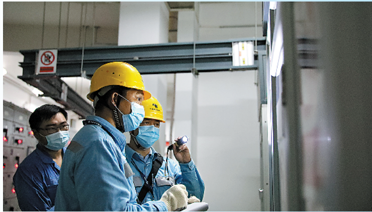
江门开平供电局供电人员正在对配电房进行检查