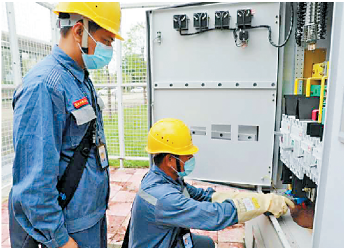
台山供电局供电人员正在检修上川景区供电设备

说。开平碉楼作为世界文化遗产之一,每年国庆长假都会吸引众多游客前来旅游参观。江门开平供电局供电人员针对景区特点,提前检查整个景区的设备安全状况,与景区工作人员沟通协调每个活动保供电,确保满足活动现场的用电需求。并组织党员义工服务队上门为景区开展了用电“问诊”,加大安全用电宣传力度,对景区用电安全、供电可靠性提出合理化建议,保障假日期间的“用电无忧”。