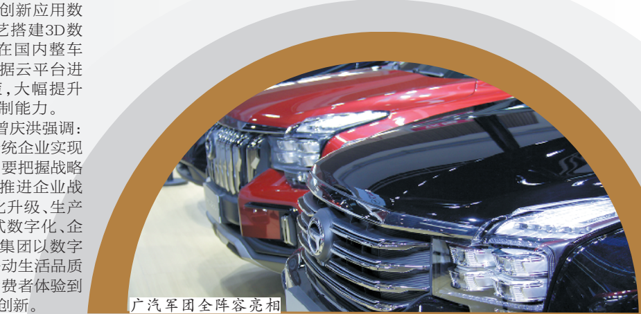
广汽军团全阵容亮相

广汽集团正在向科技型企业转型。本次车展上,广汽旗下两大自主品牌事业均发布科技满满的“硬核”。广汽传祺正式发布广汽全新动力总成平台品牌“钜浪动力”技术品牌,基于钜浪动力打造的动力总成产品,全面满足“国六b”排放标准,带来更强劲的动力、更敏捷的响应、更低的油耗。其中,钜浪动力发动机涵盖1.5L、2.0L、DHE三大平台,以汽油机燃烧控制系统(GCCS)技术为核心,集成高效增压、低摩擦、智能热管理、低压废气再循环和实时控制技术,具备高效率、低油耗等优势,第四代发动机最高热效率达42.1%,代表目前世界上汽油机产品热效率的领先水平。 钜浪动力变速器涵盖AT、WDCT、DHT三大平台,搭载广汽首创的电液控制系统,应用双离合模块、电子泵与机械泵双泵技术,具备更快的换挡响应、更精确的换挡控制及更高的传动效率。7WDCT变速器综合传动效率达96%,最大传递扭矩达400N·m,换挡响应低至0.2s。 荣获“世界十佳变速器”称号的G-MC机电耦合系统,应用广汽独创的多挡位双电机技术,以及高效传动和离合器精确控制技术,节油率超35%,搭载整车百公里油耗低至4L。 广汽新能源发布全球首創高性能两挡双电机“四合一”集成电驱。通过双电机+控制器+两挡减速器深度集成,在“三合一”电驱基础上实现再次升级,带来340kW狂暴动力性能和高达90%综合驱动效率,功率提升13%的同时,体积减小30%,重量减轻25%,并拥有多种驱动模式和OTA智能进化等技术优势,获得专利70余项。“四合一”集成电驱的诞生,标志着埃安动力科技跨入3.0阶段,并将使中国汽车百公里加速迈进2秒时代。 科技创新也推进了产业生态链的完善。9月7日,广汽集团首家内部孵化技术创新公司——广州巨湾技研有限公司完成注册,标志着广汽集团在高科技产业化应用领域迈上新台阶。