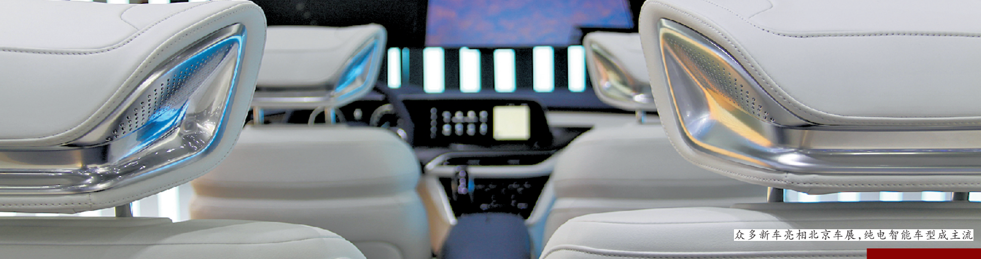
众多新车亮相北京车展,纯电智能车型成主流