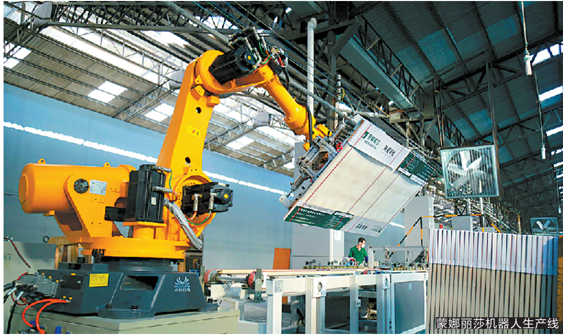
蒙娜丽莎机器人生产线

存量土地的潜力,加快推动村级工业园区改造。《意见》鼓励企业参与“工改工”,符合条件的企业,补助额度提升、分割单元面积限制降低、分割比例加大。