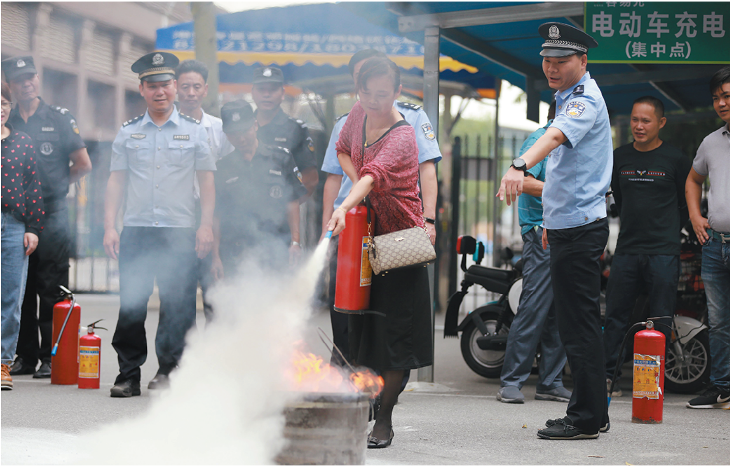
民警指导市民进行灭火实操

顺德政数局相关负责人表示,今年国庆、中秋叠加假期,智慧顺德顺利通过常态化防疫与有序开放的双重考验,实战技能得到提升。未来,依托智慧顺德建设,数据会穿透城市治理的方方面面,进一步推进数字技术与经济发展、政府改革、社会民生等方面深度融合,而随着智慧建设体系不断延伸,顺德幸福智城的内容将不断丰富,推动顺德以全新的面貌拥抱数字化时代,为数字经济高质量发展贡献顺德力量。