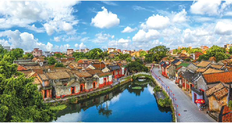
珠三角地区保存最为完整的明清古建筑群

这座古村落始建于南宋，是茶山镇南社村的重要组成部分，更是明清时期的重要历史见证，具有鲜明的岭南广府文化特色，先后被评为“中国历史文化名村”“全国重点文物保护单位”“中国景观村”“中国传统村落”“中国民族优秀建筑——魅力名村”“4级国