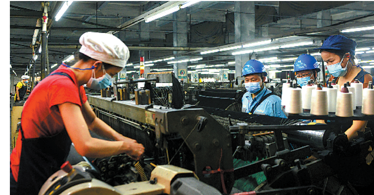
东莞西北部供电局中堂供电服务中心工作人员走进科纺纺织有限公司进行用电检查

恢复，在下半年销售量比上半年平均增加10万米布，整体呈现平稳向好的态势。” 今年1—9月，东莞全市纺织服装行业用电量累计16.64亿千瓦时。东莞西北部供电局相关工作人员表示，随着双十一临近，该企业订单量也随之增加，9月单月用电量就达到14万千瓦时，较上月增长9%。为了保障企业顺利生产，西北部供电局每日监测企业用电负荷情况并安排专人上门服务，开展用电检查，确保企业