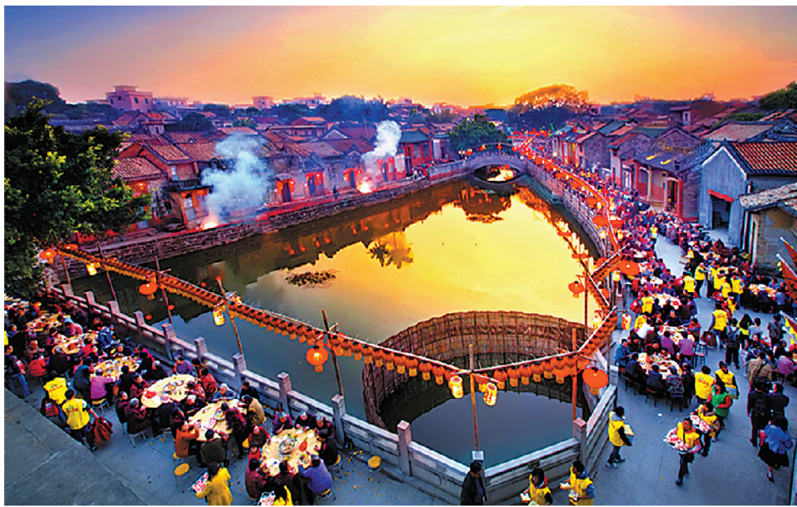
百岁斋邀请村内老人一起享用美食

之所以能荣获全省首批“家教家风实践基地”称号，正是与南社明清古村落一直崇尚的孝德文化治家，民风淳朴密不可分。 茶山镇有关负责人告诉记者，近年来，南社利用茶山镇实施乡村振兴战略、建设“一村一品”项目的契机，围绕“孝德”主题，除了推进村居、旅游配套的基础设施建设和特色优势整合提升外，还通过复办“忠孝文化节”“南社斋醮”等传统节目，举办“好媳妇”评选，挖掘雕塑、挂画、泥公仔等传统手工艺制作，传承良好家风家训，弘扬孝德优秀传统文化，以此实现乡村文化振兴，增强群众的幸福感和获得感。 该负责人表示，接下来将以创建南社“孝德村”为载体，发挥“广东省家教家风实践基地”的示范引领作用，在全镇各村（社区）广泛开展孝德建设，着力营造孝敬父母、关爱老人的社会氛围。