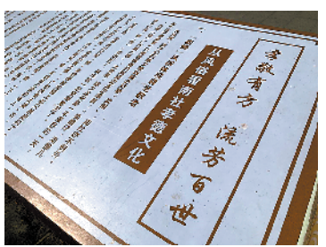
从风俗看南社孝德文化