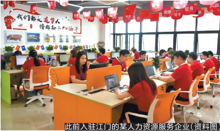
此前入驻江门的某人力资源服务企业(资料图)

选结果将于10月30日正式公布。 据了解,近年来,珠海市政府以集中力量解决群众关注的民生实事为着力点,陆续建设多个便民利民体育设施,广泛开展形式多样的全民健身活动,推进“城市社区10分钟体育健身圈”建设,把“健康中国,健康珠海”落到实处。截至2019年年底,全市社区体育公园数量达到300多处,人均公共体育场地面积超过5平方米,基本实现城市社区10分钟健身圈。