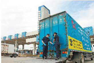
海关关员检查“跨境一锁”电子关锁工作情况

两地海关利用同一把具备卫星定位功能的安全智能关锁,以“一锁到底,全程监管”为目标,实现对车辆及所载货物全程监管、在陆路口岸自动快速验放。应用粤澳海关“跨境一锁”模式通关的进出口货物应符合海关总署2017年48号公告的限定范围,一般认证及以上信用等级企业出口非重点敏感商品,也可应用该模式。目前,粤澳海关“跨境一锁”已覆盖的广东省52个清关点,均可作为粤澳海关“跨境一锁”模式清关点。