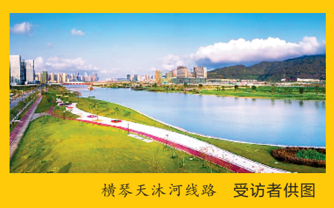
横琴天沐河线路