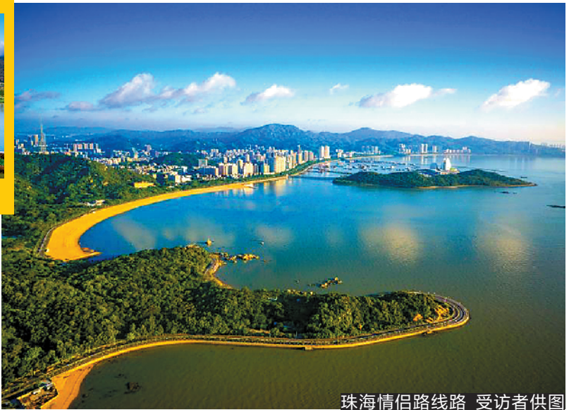
珠海情侣路线路

羊城晚报讯 记者钱瑜报道:为倡导广大市民走到户外、强健体魄,推动“体育+文化+旅游”高质量融合发展,展现珠海优美的人文自然环境,传播健康向上、青春活力的珠海城市文明元素,中共珠海市委、珠海市人民政府、珠海市体育总会、横琴马拉松组委会、华发体育联合举办“跑人气赛道,创文明城市——珠海十佳跑步路线”评选活动。 据悉,本次评选将从涵盖珠海全区域的24条典型路跑线路中,其中包括情侣路沿线、横琴天沐河畔、金湾路、南水森林公园等各区极具特色的路跑线路,通过网络投票+专家评审的方式,综合评分后,甄选出十佳路线。候选跑步路线总长度均在4公里以上,除具有一定知名度和口碑,深受市民欢迎外,还具备良好的的人文文化精神底蕴,能展现珠海特区40年城市发展变迁,反映珠海人的精神风貌与健康追求。