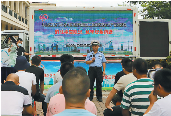
“坪安课堂”走进企业