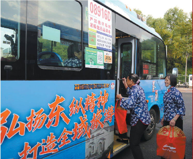
红色巴士线路开通