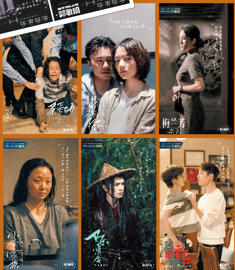
首轮竞演后,八位演员获S卡

对此,初始评级制作人纷纷表示,有些“老戏骨”由于近年来缺少作品和活跃度,只能给出B级评判。这种貌似“残酷”的结果实则体现了如今的演员行业生态,在市场导向下,如果不能保持作品的持续输出和个人的曝光,往往只能“坐冷板凳”,甚至被行业淘汰。