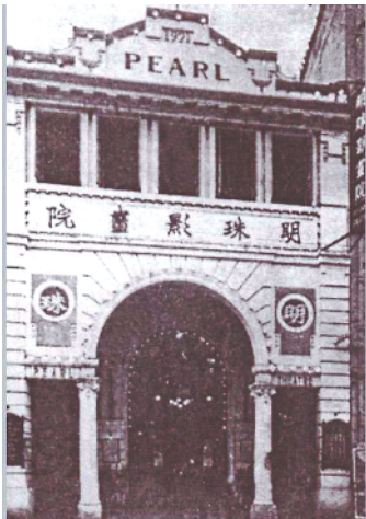
1921年建成的位于长堤的明珠影画院,它是无声电影时期广州规模最大、设备最好的影戏院

清末民初,广大路口开了一家“通灵台”,是广州最早的电影院之一。“通灵”二字,反映出中国人对电影艺术的理解。不久城隍庙附近也开了一家,叫“镜花台”,意思是从这里可以走入一个疑幻似真的奇妙天地。默片(无声电影)时代,电影院常用广东音乐在现场伴奏,二弦、三弦、高胡、椰胡、洞箫高奏着畅快淋漓的广东音乐,观众十分过瘾,甚至把广东音乐称为“国乐”。电影院的座位分成许多等级,但名称都起得很好听。1925年在明珠影院看一部无声电影,包厢位3.5元、明珠位8毫、和平位4毫、大同位2.5毫、花园椅1.5毫。至于明珠位与和平位有什么区别,只有进了影院的人才知道。这是超级豪华的享受了,在十八甫的一新影院,最贵的二楼散席座位,也只3毫。