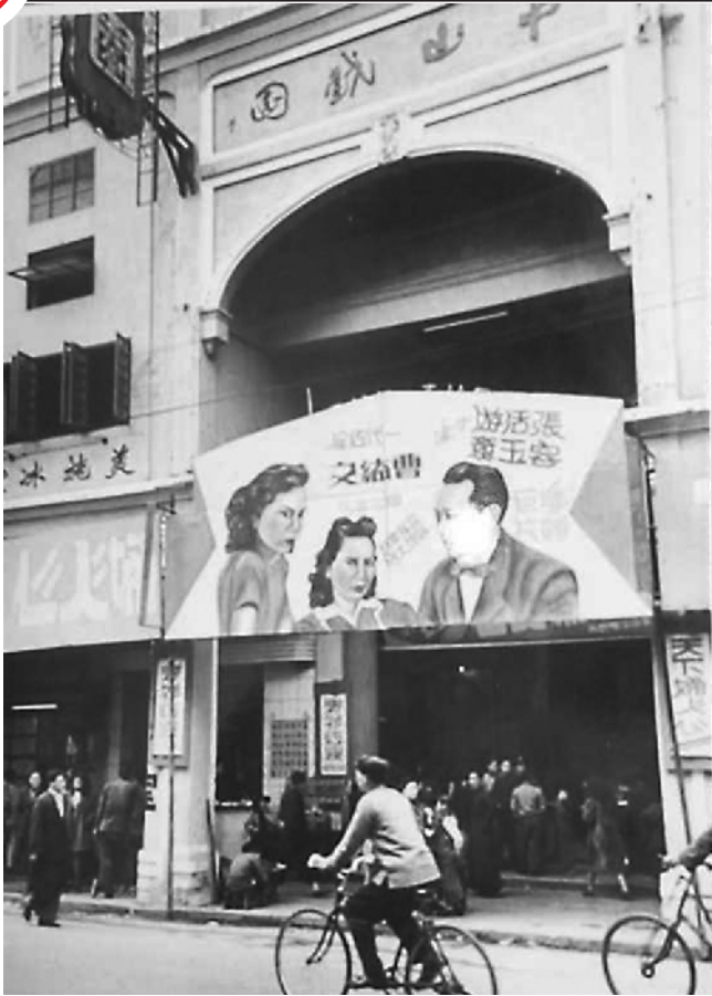
民国年间,位于上下九路的中山戏园

每有新戏上映,电影院门口便排起买票的人龙。“浪漫奇情巨片《玉骨冰心》”“肉感、香艳、销魂歌舞巨片《万花团》”,是报纸上常