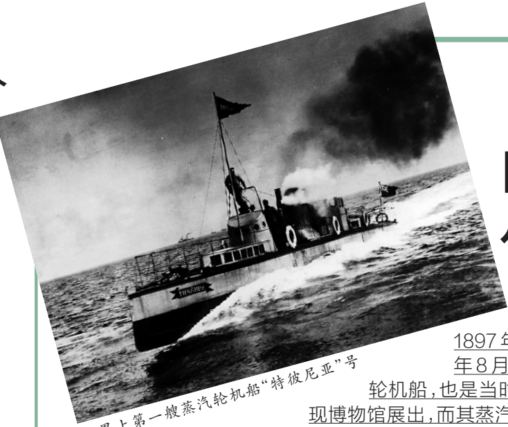
世界上第一艘蒸汽轮机船“特彼尼亚”号