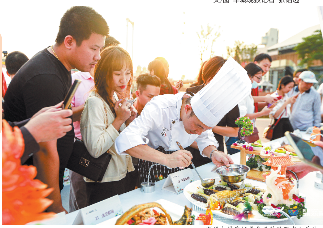
顺德大厨烹饪美食吸引了不少人关注