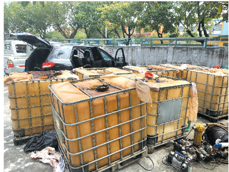
警方缴获的涉案物品

警方也提醒,作为货车司机,要将自己的车辆停在光亮、有人值守的地方,做好防范措施;货车司机在有条件的情况下,可以为货车油箱安装防盗器;如果发现柴油被盗,应该第一时间进行报警,并告诉警方车牌号、加油金额、被盗时间等详细信息。