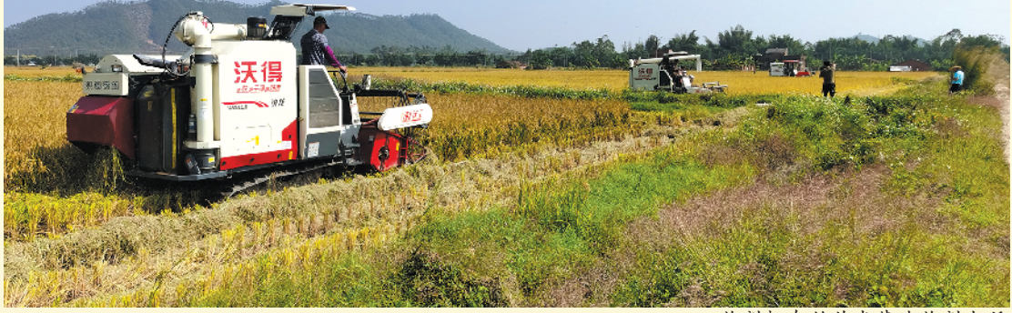
收割机在丝苗米基地收割水稻

羊城晚报讯 记者彭纪宁,通讯员谭耀广、李渊深摄影报道:金秋时节,稻谷飘香,又到晚造水稻收获时,江门恩平市国家级万亩水稻生产示范基地到处都是丰收景象。