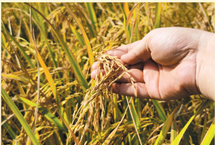
金灿灿的优质丝苗晚稻

据了解,今年恩平市晚造水稻播种面积约19.96万亩,较往年同期略增0.06万亩,主要品种有象牙香占、华航丝苗、五山丝苗、粤禾丝苗、美香占2号等常规优质丝苗米品牌和Y两优系列、野香优系列优质杂交稻品种,水稻良种覆盖率达97%。预计单产约370公斤/亩,比去年同期增产9.5公斤,总产7.36万吨,比去年同期增产近1900吨,较好地完成了今年粮食生产任务。