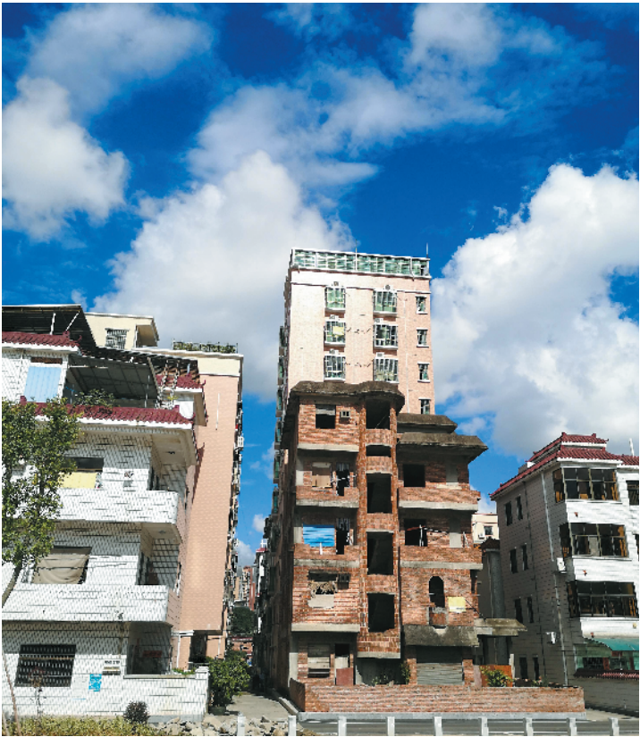
东莞进一步规范农民住房建设

得超过“一宅”规定上限(即宅基地总用地不超过150平方米,总建筑面积不超过总用地的4倍)。因此,建房户申请建设农房时,镇街审批部门需通过全市农房台账对所属家庭宅基地使用和农房建设的情况进行核查。