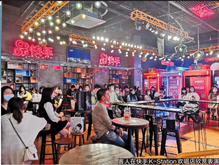
客人在快手K-Station欢唱店欣赏表演

广州天河电脑城推出广州“首店”以来受到了不少游戏爱好者的青睐。据了解，腾讯视频好时光结合了索尼、京东等资源，集游戏、动漫、体育、影视等多元文化娱乐形态于一体，而在广州天河电脑城店还置入了索尼游戏独家线下体验空间Play Station。羊城晚报记者近日走访发现，在广州荔湾悦汇城，腾讯视频好时光在广州的第二家门店已悄然开业，据店员介绍，该店在10月底试营业，11月初正式开业：“未来几年可以在广州看到更多腾讯视频好时光的门店，且都会进驻到商圈里。”