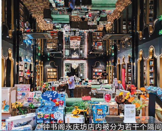
钟书阁永庆坊店内被分为若干个隔间