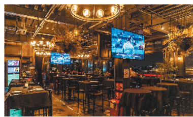
↓科奇娜餐厅装修风格偏工业风