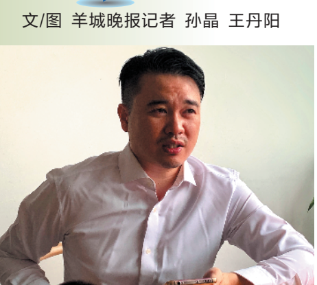
文/图 羊城晚报记者 孙晶 王丹阳

金借助外方股东在量化投资上的优势,在量化投资上持续发力。目前,正在发行的景顺长城量化成长演化混合基金,将利用量化投资优势布局七大投资主题,力争通过把握行业主题贝塔(β)和优质个股阿尔法(α)获得双重收益。(杨广)