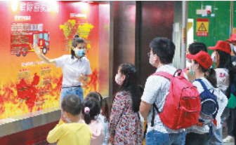
亲子家庭参观深圳市安全教育基地

近日,宝安区西乡街道河东社区妇联开展“扣好人生第一粒扣子,迈出生涯第一个台阶”亲子教育活动,组织50个亲子家庭参观深圳市安全教育基地和罗湖区生活垃圾分类教育体验馆。