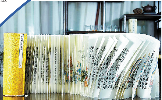
裕同科技制作的龙鳞卷

近年来,裕同科技积极布局文创领域,探索文化创意与印刷技术的结合,多次携带新品参加文博会