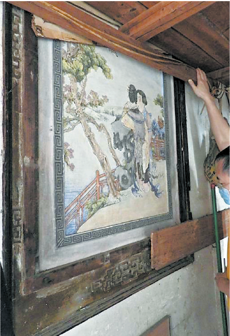
灰塑的上半部分被放杂物的阁楼完全遮挡,一块大木板被钉在灰塑精美的木质装饰框上