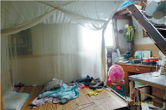
蚊帐的背后,是一幅灰塑;蚊帐上面是住人的阁楼,右边是上阁楼的楼梯