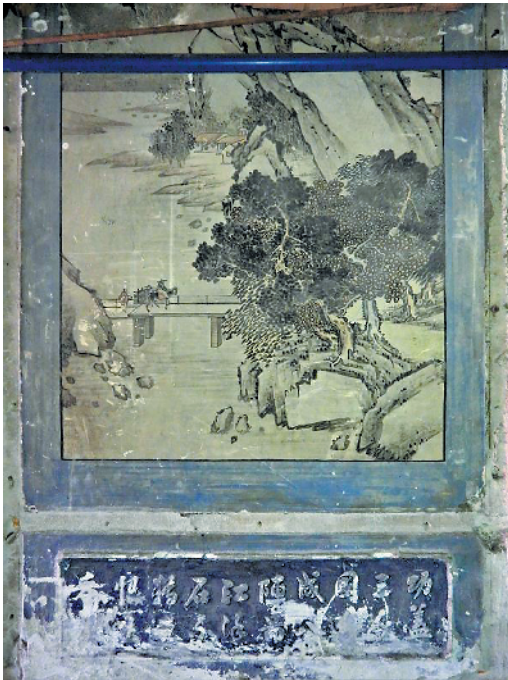
灰塑书法《八阵图》损坏严重;上面的壁画只能看到下半部分,上半部分被放杂物的阁楼遮挡,电线和水管就从画面上横跨而过

鉴于灰塑目前所处的状态,记者特意隐去钱庄的具体名字和地址,以免珍贵的历史文物遭到新的破坏。我们希望有关部门马上彻查跟进,拿出相应的保护措施。