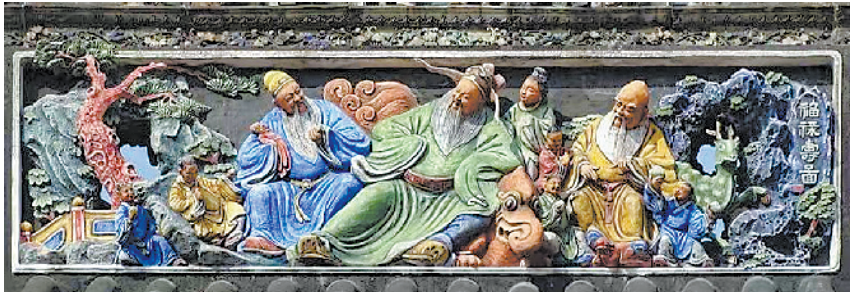
陈家祠头门上的灰塑《福禄寿图》

介绍陈家祠的文字常这样写道:这是一座集广东传统建筑装饰艺术之大成的璀璨殿堂,以精巧绝伦的“七绝”著称。所谓“七绝”,指的是木雕、砖雕、石雕、灰塑、陶塑、壁画、铁铸七种建筑装饰形式。这七种广东传统建筑的主要装饰手段(铁铸用得稍少),各有特点,在建筑装饰中各自扮演不能代替的角色和起着不同功能。