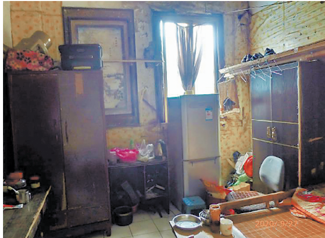
这幅叫《待月西厢》的灰塑平日就躲在大衣柜的背后

不过,眼下的这栋小洋楼,已成为“七十二家房客式”的廉租屋。地面的一层,被出租为批发光鸡的档铺,白乎乎的光鸡堆叠得满地都是,旁边只留出一幽暗的小门洞供楼上租户进出。二楼以上,以楼梯为轴心,左右两侧的厅房被分割成六个独门的单元户出租屋,有的出租住人,有的出租成为仓库。