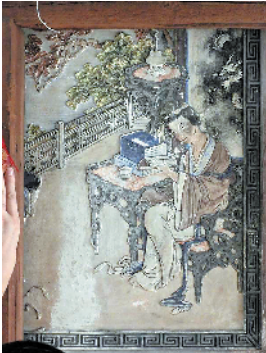
撩开蚊帐拍到的灰塑画面