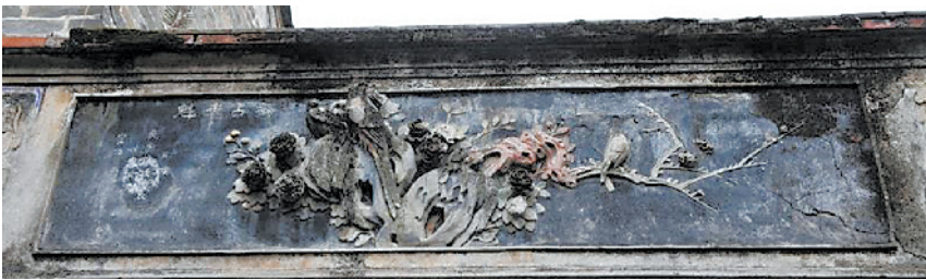
番禺小谷围民居居里的灰塑《独占春魁》,塑于1916年(网络图片)

灰塑制作工艺复杂精细,塑制过程简单来说是这样:先以开边瓦筒、铜铁线来扎制人物、动物、鱼虫的躯干、筋骨